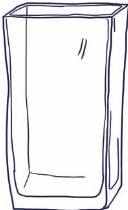
eine große Vase aus Glas